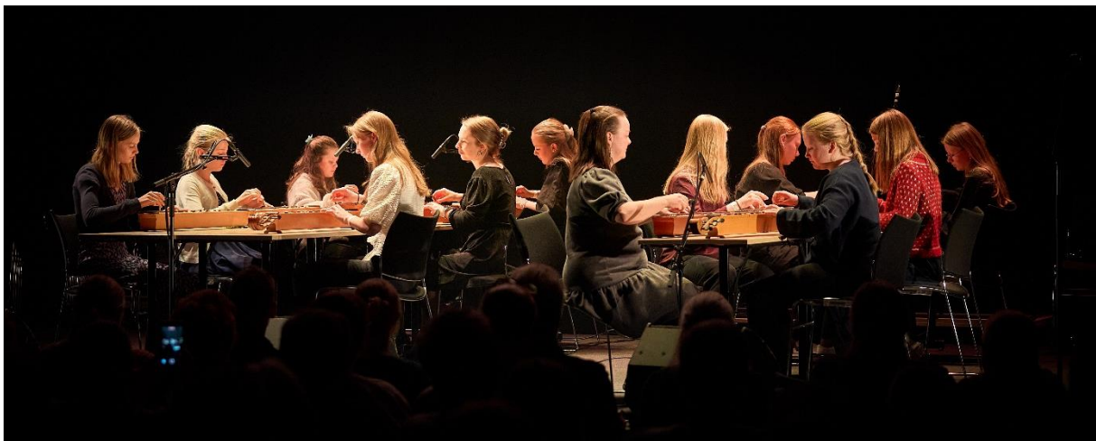
Barn og unge fra forskjellige steder i landet