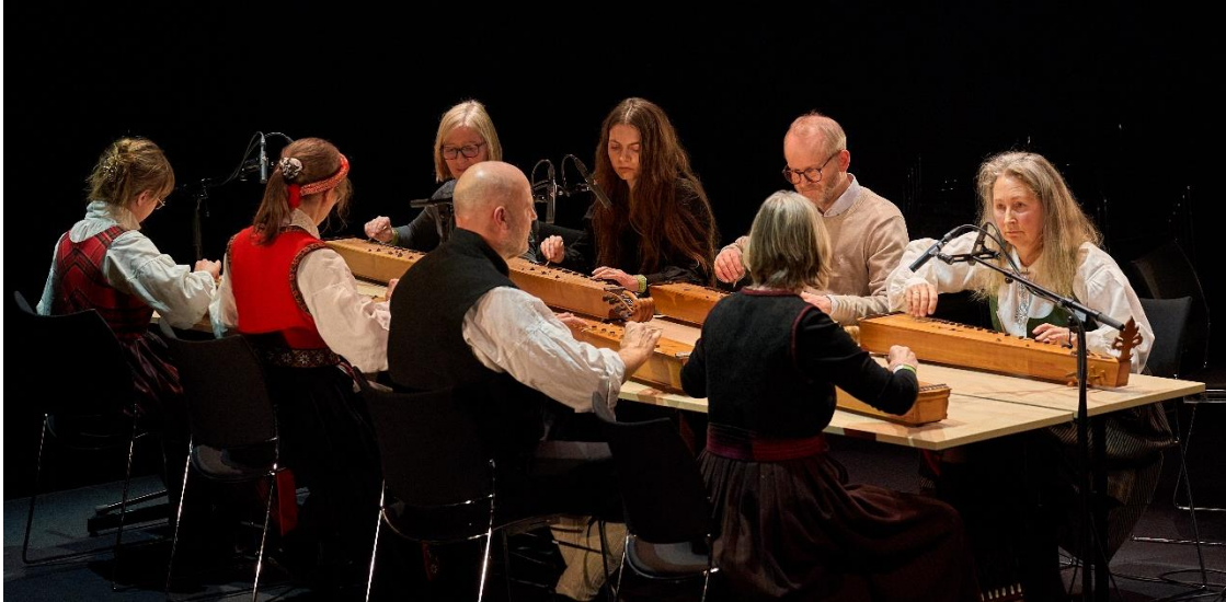
Valdreslaget i Oslo – Langeleikgruppa